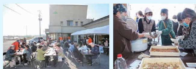
写真＝地元組合員や住民らでにぎわった収穫感謝祭