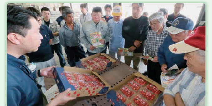
写真＝ブランド産地にふさわしいサクランボを一。出荷規格を確認する生産者ら（寒河江市で）

1 キ 当たり平均単価は、前年より416円高い3510円（同121%）で、販売高は3018万円増の13億1859万円（同71%）となりました。 収量減の大きな要因は、主力品種「佐藤錦」の結実不良です。開花時期の天候不順などで受粉を担うミツバチの活動が鈍り、結実数の減少につながりました。 晩生種の主力「紅秀峰」