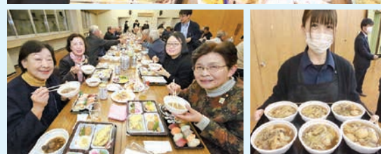
写真＝旬の料理で、楽しいひとときを過ごした西川地区の組合員