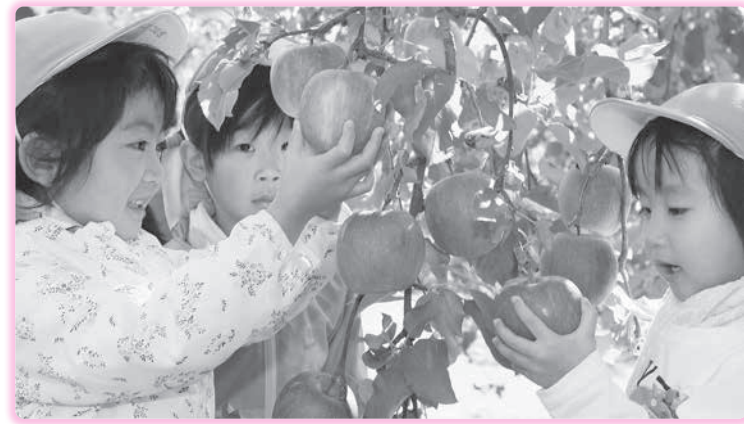
写真＝検査用の「ふじ」をもぎ取るあさひ保育園の園児たち