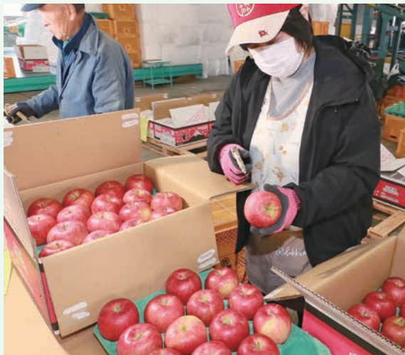
写真＝輸出用リンゴの出荷作業に追われる作業員

J A管内で、本年産リンゴの輸出が本格化しています。今季は台湾やマレーシア、香港、タイ、フィリピンのアジア5カ国・地域へ、昨年を約30 ト 上回る200 ト を出荷する計画です。